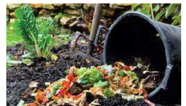
Compostage en tas dans le jardin