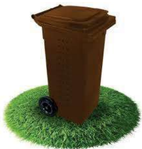
Bac biodéchet pour collecte en Porte-à-Porte

J'utilise un sac compostable uniquement pour la collecte des biodéchets en porte-à-porte. Les sacs, même compostables, sont interdits dans les composteurs