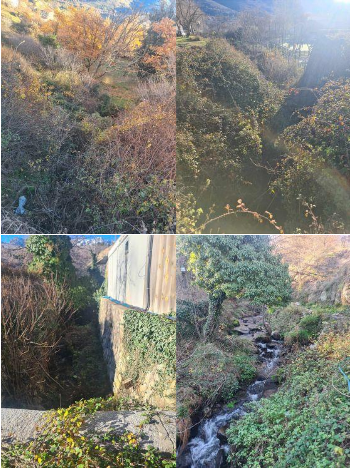
Figure 2: Photographies ruisseau 1