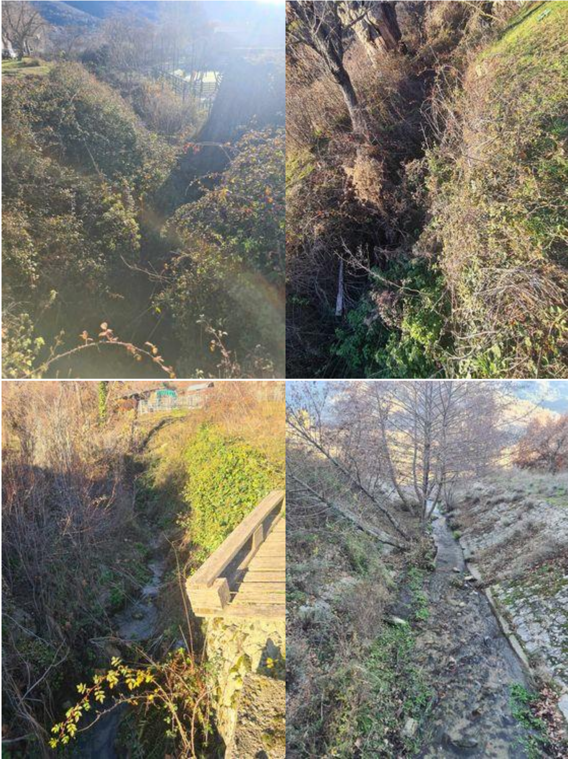
Figure 3: Photographies ruisseau 2